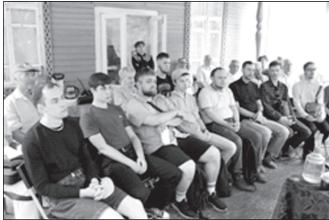
Участники научного семинара.

На съезде развернулась острая дискуссия по организационному устройству партии. Ю. Мартов считал, что члену партии достаточно поддерживать партию материальными средствами, оказывать ей регулярное личное содействие под руководством одной из ее организаций. В свою очередь