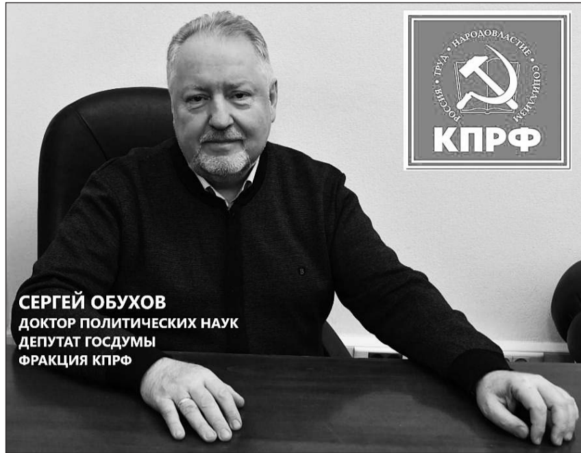
СЕРГЕЙ ОБУХОВ ДОКТОР ПОЛИТИЧЕСКИХ НАУК ДЕПУТАТ ГОСДУМЫ ФРАКЦИЯ КПРФ

Депутат Государственной Думы, член Президиума, секретарь ЦК КПРФ, доктор политических наук С.П. Обухов - в эфире «Красной линии» о своем видении структуры российского общества.