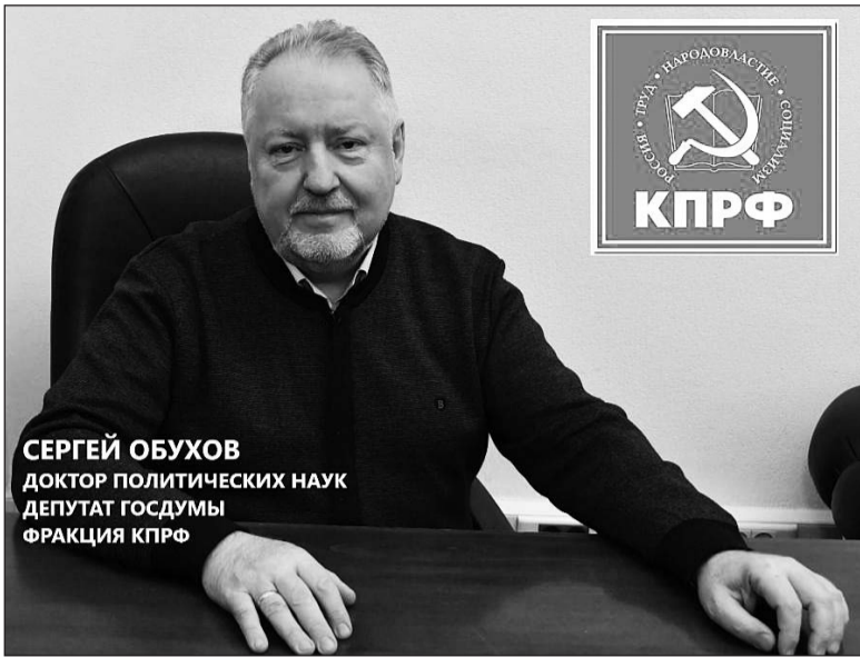
СЕРГЕЙ ОБУХОВ ДОКТОР ПОЛИТИЧЕСКИХ НАУК ДЕПУТАТ ГОСДУМЫ ФРАКЦИЯ КПРФ

Депутат Государственной Думы, член Президиума, секретарь ЦК КПРФ, доктор политических наук С.П. Обухов выступил в эфире «Красной линии», прокомментировав события 33-летней давности.