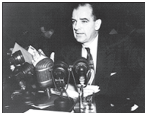
Джозеф Рэймонд Маккарти.

В.И. КОРНИЛОВ , первый секретарь ЯО КПРФ (1993-2000 гг.). (Продолжение следует)