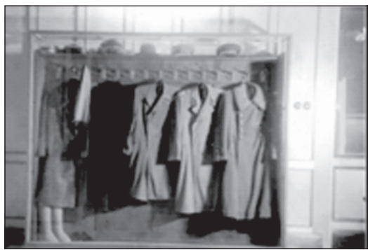
Личные вещи Сталина.

Другой пример. Три десятка лет М.А. Сулов ходил в одном и том же пальто, пока Л.И. Брежнев не выдержал, сказав на заседании Политбюро ЦК КПСС: "А что, может, скинемся Мише на новое пальто?". Сулов пальто купил, но привычкам своим и представлениям о жизни не изменил до конца. После смерти - разбирая его бумаги, выяснили, что он регулярно перечислял часть зарплаты... в Фонд мира. Главный идеолог партии не выставлял это напоказ, полагая, что ему, как коммунисту, необходимо так поступать. Даже, если кто-то из руководящих партийно-государственных деятелей, как, например, Л.И. Брежнев, и выделялся, то у них не было в собственности ни дворцов, ни миллионов рублей на банковских счетах.