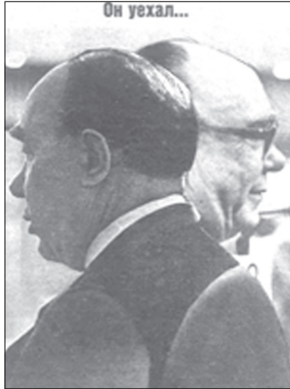
Двуликий Янус - А. Яковлев.

Особую роль в дискредитации идей социализма, уничтожении советской власти сыграл политический предатель, "архитектор перестройки", ближайший сподвижник М. Горбачева, секретарь ЦК по идеологии А. Яковлев. Он, задолго до вхождения в высший эшелон партийной власти, замыслил уничтожение социализма. Во вступительной статье к изданию "Чёрной книги коммунизма: преступления, террор, репрессии" (1997 г.) на русском языке, он искренне обозначил свой "вклад". "После XX съезда в сверхузком кругу своих ближайших друзей и единомышленников мы часто обсуждали проблемы демократизации страны и общества. Избрали простой, как кувалда, метод пропаганды "идей" позднего Ленина. <...> Группа истинных, а не мнимых реформаторов разработала (разумеется, устно) следующий план: авторитетом Ленина ударить по Сталину, по сталинизму. А затем, в случае успеха, Плехановым и социал-демократией бить по Ленину, ли-