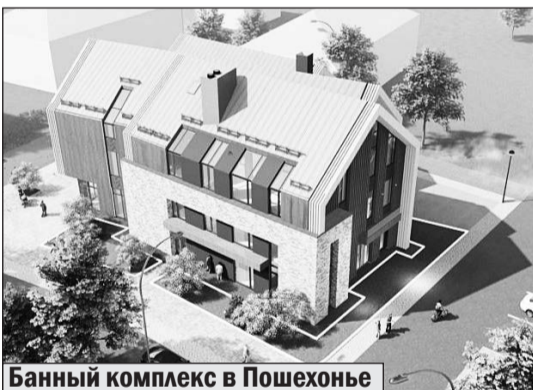
Банный комплекс в Пошехонье

На минувшей неделе в Ярославской областной Думе продолжались заседания профильных комитетов. В частности, комитет по бюджету рассмотрел исполнение основного финансового документа региона за первые 6 месяцев 2024 года. Отчет министерства финансов показал значительное уменьшение некоторых показателей по сравнению с аналогичным прошлым годом. А многие конкретные цифры оказались весьма далеки от плановых значений. Притом, проблемы, возникшие в первом полугодии, окажут влияние на бюджет в целом. А их последствия «аукнутся» вплоть до 2025 года.