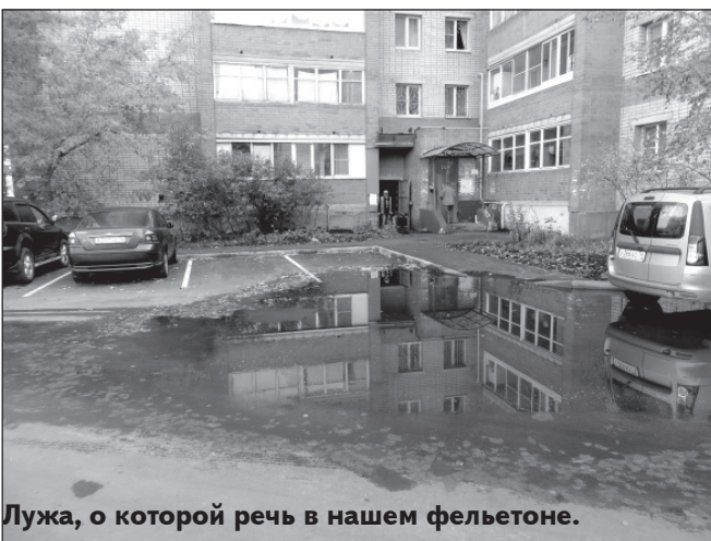
Лужа, о которой речь в нашем фельетоне.

будет. То ли и у комиссии уровня не было, то ли и их профессиональный уровень оказался низким, то ли, наоборот, уровень их халатности был настолько высок, что им до лямпочки было - образуется лужа