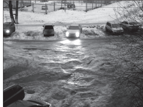
Так было минувшей зимой у д. №3 по ул. Строителей в Ярославле.

Ладно, работники, которые приехали из краев, где дожди - редкость. А те, кто принимал у