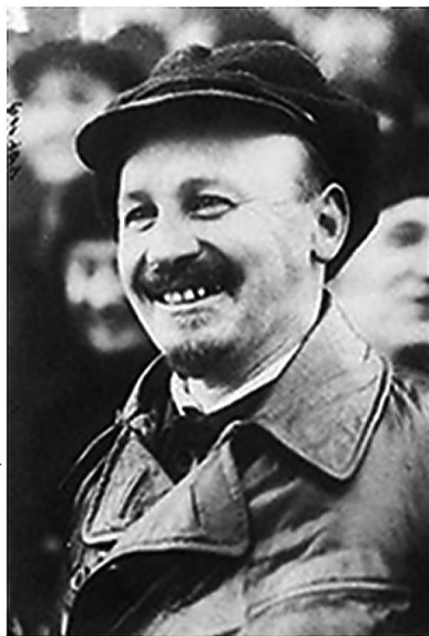
Фотомонтаж из открытых источников.