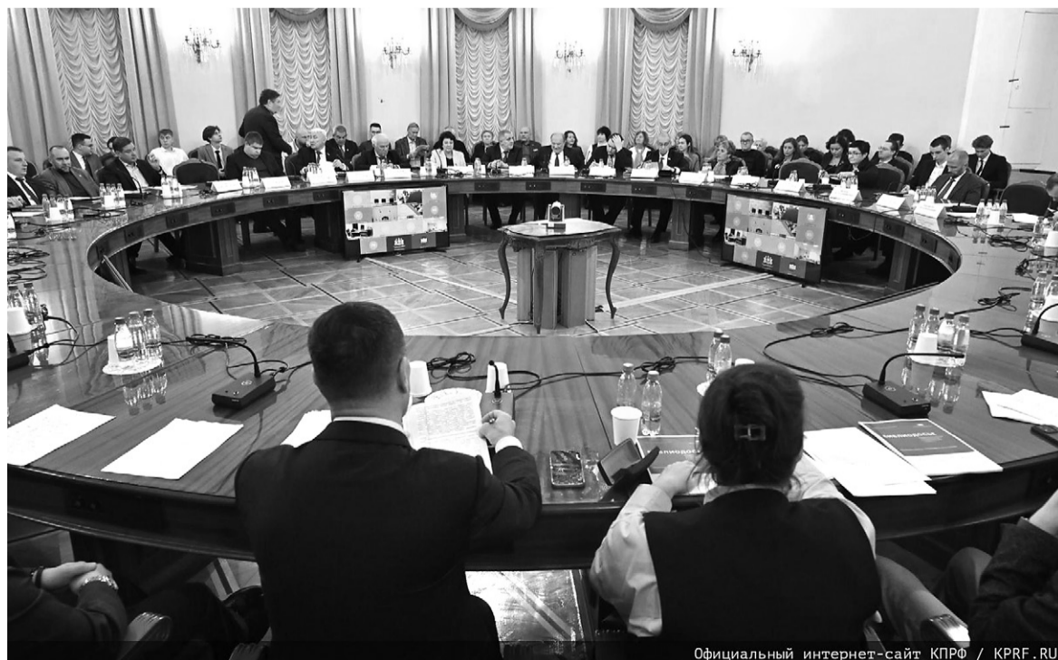
Официальный интернет-сайт КПРФ / KPRF.RU