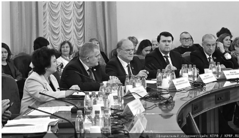
Официальный интернет-сайт КПРФ / KPRF.RU

Даже Председатель Совета Федерации Федерального собрания Российской Федерации Валентина Матвиенко признала, что мусорная реформа забуксовала в России. Собирались к 2024 году 36% отходов перерабатывать, а к 2030 году – 100%. А сегодня в итоге перерабатываем – 13%