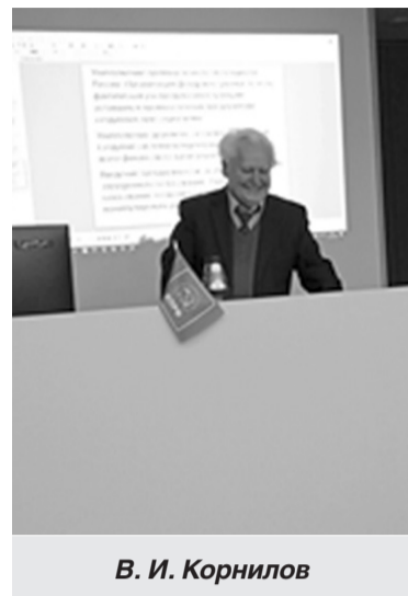
В. И. Корнилов

В последние годы возникает много рассуждений и дискуссий об историческом значении деятельности Сталина. С одной стороны, либералы делают упор на доказательстве якобы репрессивного характера сталинской политики, значительно преувеличивая негативные моменты, при этом, не замечая огромных преобразований, произошедших в период сталинизма в стране и мире. По мнению В.Ю. Катасонова , «Сталин не был профессиональным экономистом». И, действительно, многие теоретические положения начального периода деятельности Сталина свидетельствуют о том, что он только начинал познавать основы государственного управления экономикой. В дальнейшем соединение теоретических и практических знаний позволило Сталину создать одно из величайших государств в мире – Советский Союз. Сталин, как теоретик экономики , пытался разобраться в проблемах политической экономии, во многих концептуальных по-