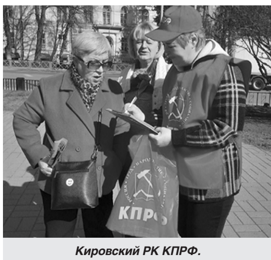
Кировский РК КПРФ.