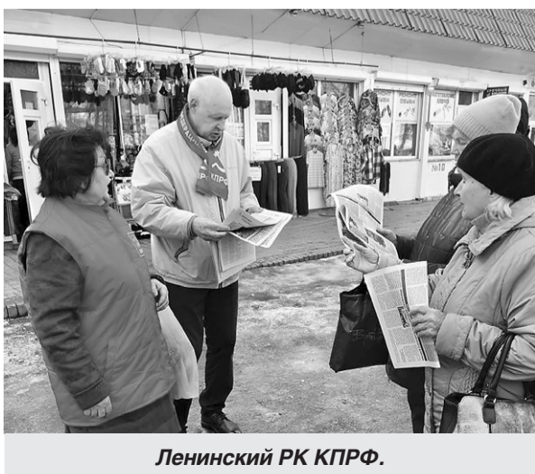
Ленинский РК КПРФ.