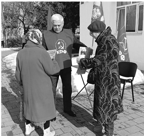
Переславский РК КПРФ.