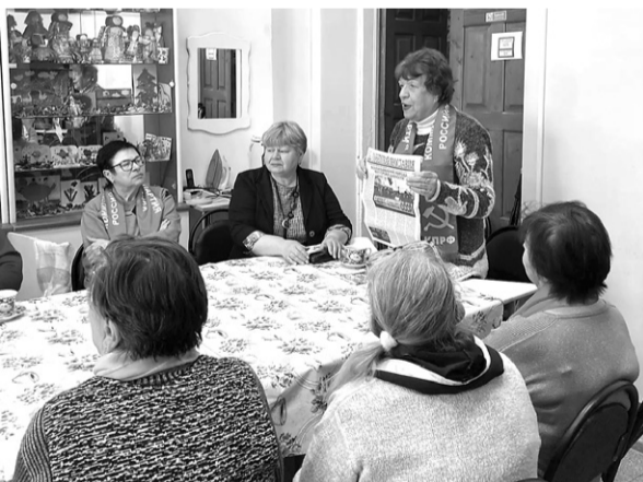
Гаврилов-Ямский РК КПРФ.