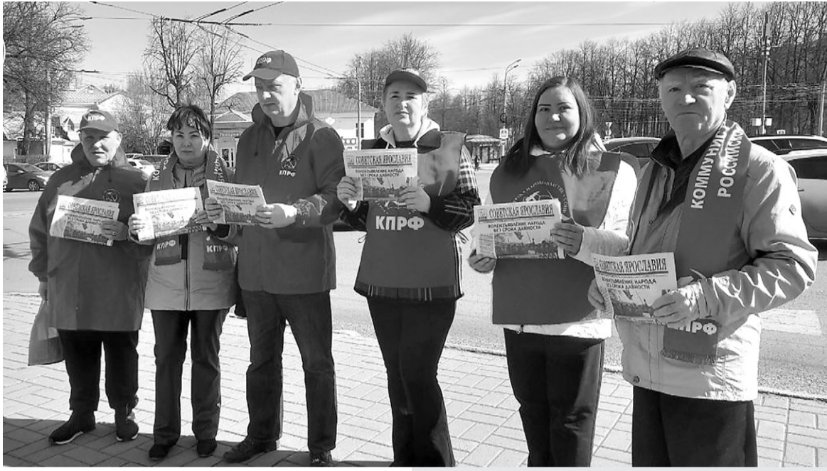
Кировский РК КПРФ.

35 лет назад, 17 марта 1991 года, состоялся Всесоюзный референдум о сохранении СССР, на котором его народы высказались за сохранение территориальной целостности страны.