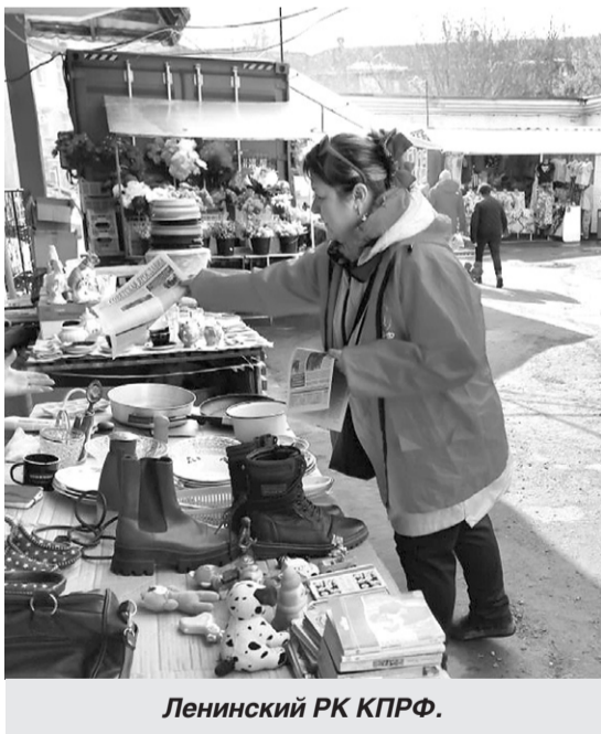
Ленинский РК КПРФ.

В ходе акций происходил сбор подписей под Народным референдумом КПРФ. Жители, принимающие участие в референдуме, отвечали на вопросы, волнующие всех - вопрос ограничения роста цен, национализация ЖКХ, отмены «пенсии реформы», требования принятия федерального закона «О детях войны» и возвращения прямых выборов глав городов и районов Ярославской области.