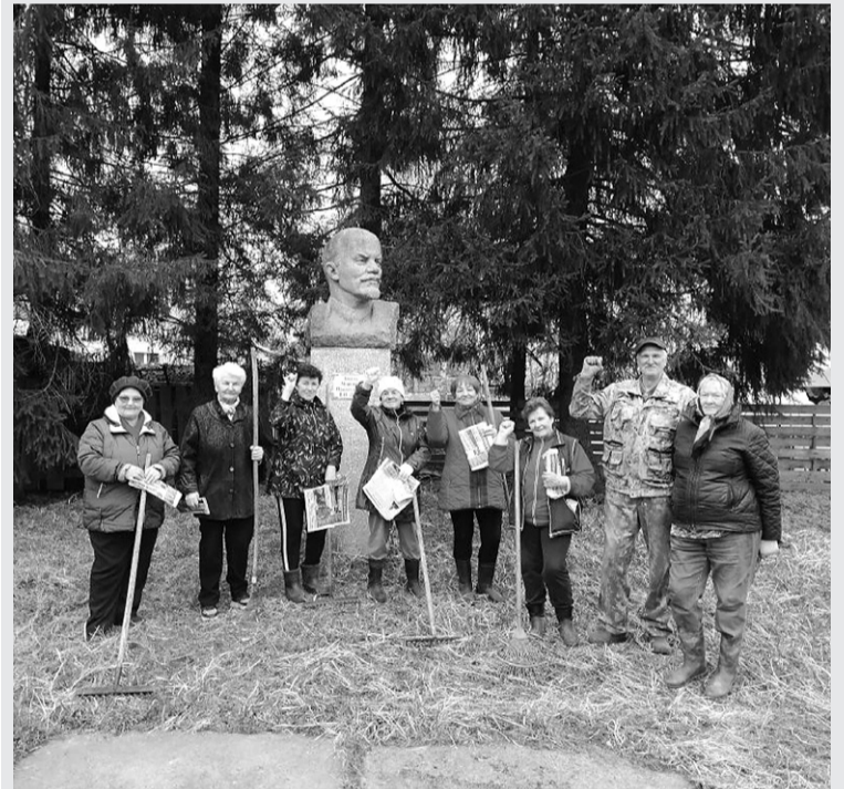
Местком ЛКСМ РФ поселка Тихменево.

Р. С. Уважаемые жители посёлка Тихменево! Члены Месткома всегда рады оказать вам посильную помощь, а также предоставить политическую литературу (газету Ярославского Обкома КПРФ «Советская Ярославия»).