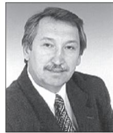
А.Д. КУЛИКОВ, депутат ГД РФ, член ЦК КПРФ.

Наступление каждого нового года русский человек связывает с надеждами на лучшее в своей судьбе, в жизни своих близких, на реализацию долгожданных желаний, на благополучие и процветание Родины. Уходящий 2009 год был для очень многих из нас еще одним периодом испытаний в череде тяжелых времен последних десятилетий. Он не разрешил и малой части проблем, важнейших для большинства российских семей и для Отечества в целом.