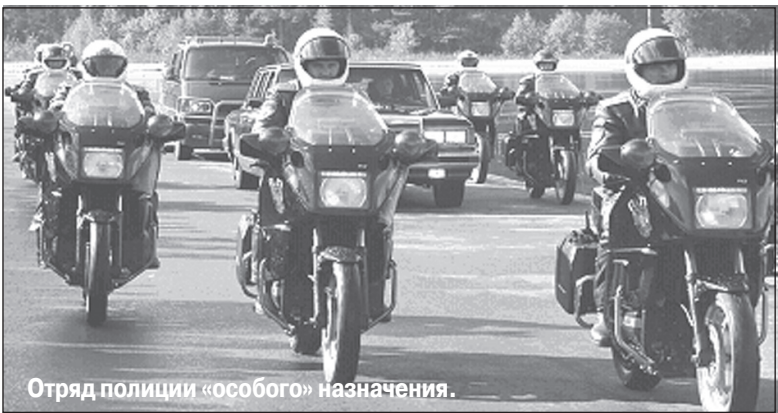
Отряд полиции «особого» назначения.